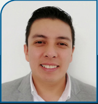
Autor: Eliei Morales Lara.

Maestro y licenciado en derecho, especialista en el ámbito tributario / Abogado postulante y asesor jurídico especialista en estrategia y defensa fiscal / Socio fundador y directivo de TRIBUTÓPOLIS, empresa dedicada a los impuestos y servicios legales / Articulista con más de tres años colaborando con “Panorama Universitario” revista de cobertura nacional, enfocada a la comunidad universitaria del país / Conferencista y expositor a nivel nacional en temas tributarios de actualidad.