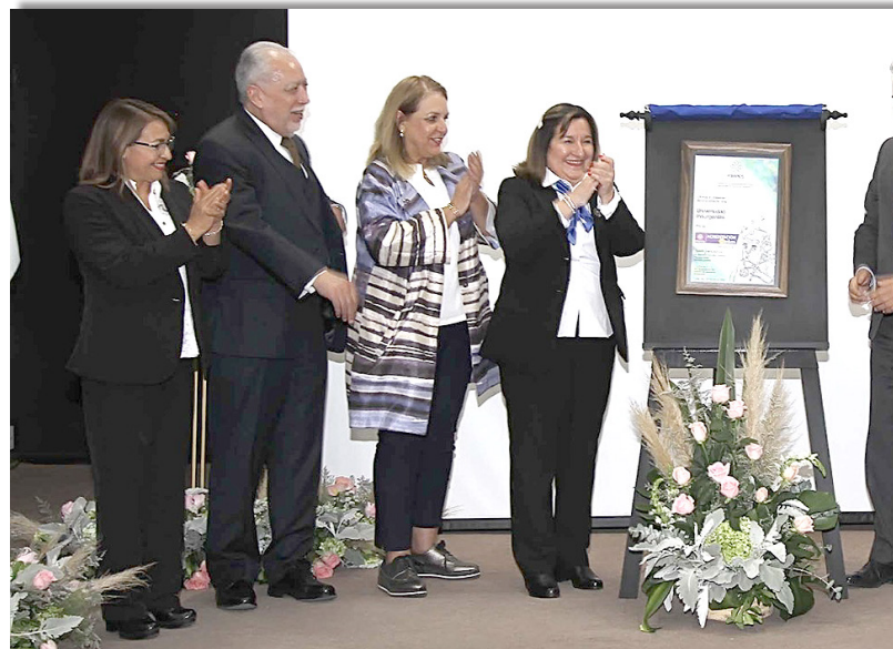
Develación de la Acreditación FIMPES.