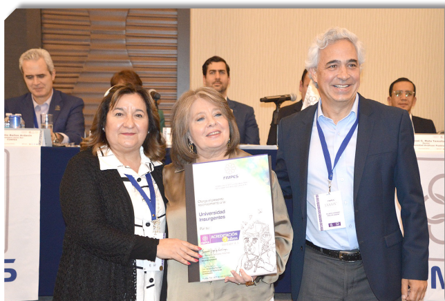
FIMPES hizo la entrega de la Acreditación a la UIN.

El pasado 21 de abril, la Universidad Insurgentes recibió una excelente noticia que llena de orgullo a toda su comunidad educativa. Después de un riguroso proceso de evaluación, la FIMPES otorgó a la universidad la Acreditación por un periodo de 7 años. La entrega oficial del reconocimiento tuvo lugar en la LXXXIV Asamblea Ordinaria de la FIMPES en la ciudad de Puebla. Para la Universidad Insurgentes, este logro es el resultado del compromiso y esfuerzo de toda su comunidad educativa, quienes han trabajado con dedicación y pasión desde el primer día para garantizar la calidad académica en sus programas y planteles. El proceso de evaluación es fundamental para asegurar la integridad y el cumplimiento de la filosofía institucional a través de las evidencias solicitadas como parte del proceso de mejora continua. El reconocimiento de la FIMPES destaca la importancia de los programas de estudio, la formación de docentes, la infraestructura de apoyo del aprendizaje y los servicios que se ofrecen a los estudiantes, ya que a partir de ellos se pueden identificar áreas de oportunidad para fortalecer la oferta académica y asegurar la formación de profesionales competentes y capaces de enfrentar los retos del mundo actual.