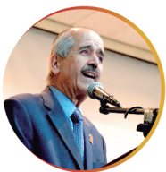
Dr. José Ángel Córdoba Villalobos Vicepresidente de la Académica Mexicana de Cirugía

El evento académico cerró con la Conferencia Magistral titulada: “Retos en Salud en México, Importancia de la Atención Primaria a la Salud” dictada por el Dr. José Ángel Córdoba Villalobos, actual Vicepresidente de la Académica Mexicana de Cirugía; ex-Secretario de Salud y ex-Secretario de Educación en nuestro país además de contar con distinciones internacionales por su carrera como Académico, Investigador y ex-Presidente de la Asociación de Facultades y Escuelas de Medicina. El Dr. Córdoba Villalobos resaltó la importancia de la participación de las Facultades y Escuelas de Medicina en los retos que implica la atención médica de la población mexicana y el compromiso que tienen las universidades para egresar profesionales de la salud con sentido ético, humano y con responsabilidad social.