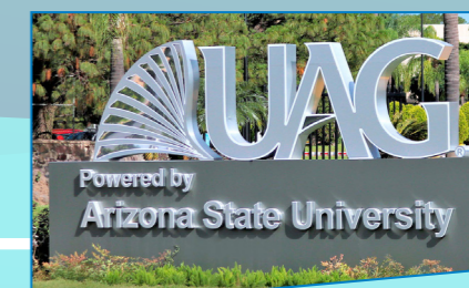
Ingreso principal al Campus Internacional UAG.