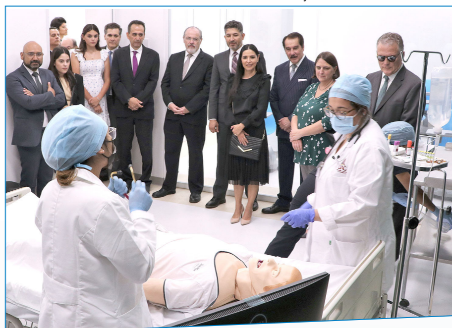
Personalidades del ámbito público, privado y diplomático conocieron el nuevo campus.

Por otro lado, el perfil académico del PIM está formado por profesores altamente capacitados que dominan el inglés técnico-médico, con estudios de posgrado y experiencia en el campo profesional de la medicina. Con este proyecto la Autónoma de Guadalajara se refrenda como una institución educativa que ofrece preparación de clase mundial, promueve la cultura de la innovación, emprendimiento con enfoque sostenible, experiencia práctica temprana con sus programas y opciones de vinculación nacional e internacional. La UAG comenzó a recibir estudiantes de Medicina con un grupo piloto en los años 70, con clases totalmente en inglés y, tras diversas reformas y convenios, en 1983 nació formalmente este programa, que a lo largo de su historia ha formado a más de 18 mil médicos de Estados Unidos y Puerto Rico. Hoy alrededor del 1% de la fuerza médica de Estados Unidos está conformada por egresados de la Autónoma de Guadalajara.