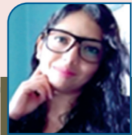
1 La autora es maestra de educación primaria en una escuela de organización completa de Morelia, Mich. Es Maestra en Educación con terminal en Educación Primaria (CAMM). Actualmente cursa el Doctorado en Educación con énfasis en Formación Profesional y Práctica Docente en el CAMM.