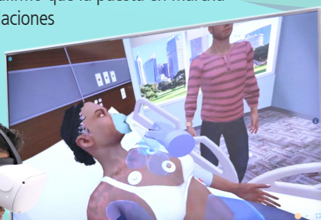
Los alumnos pueden practicar en laboratorios de realidad virtual.