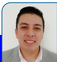
Autor: Eliel Morales Lara.

¿Es posible aplicar una salida alterna por cometer defraudación al fisco federal o alguno de sus equiparables?